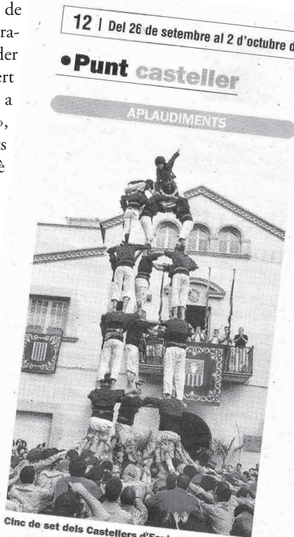
Cinc de set espluguenc • Imatge inèdita per als Castellers d'Esplugues. Els del Baix Llobregat van descarregar diumenge passat a casa, en la seva diada de festa major, el seu primer cinc de set de la història. La festa es va completar amb el tres i el quatre de set, i es va convertir en la millor actuació d'aquesta colla nascuda l'any 1994. Felicitats, Cargolins!

Ens agradaria comentar cada diada... però no hi ha lloc. Ho deixem per Nadal. Queda molta temporada per endavant, i encara podem continuar superant-nos. Fins a la victòria sempre, que diria aquell.